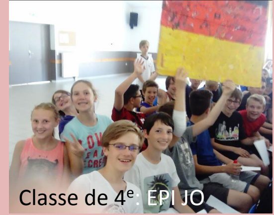
Classe de 4 e . EPI JO